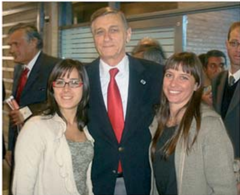
Las candidatas a legisladora Paula Hernández, y a diputada nacional Betiana Cabrera Fasolis, junto a Hermes Binner.

Tal como se reveló en los resultados de todos los distritos del país, este Frente Amplio Progresista, con la candidatura de Hermes Binner a la cabeza, nació para crecer. Ese será sin duda nuestro compromiso en la provincia de Córdoba de cara a octubre.