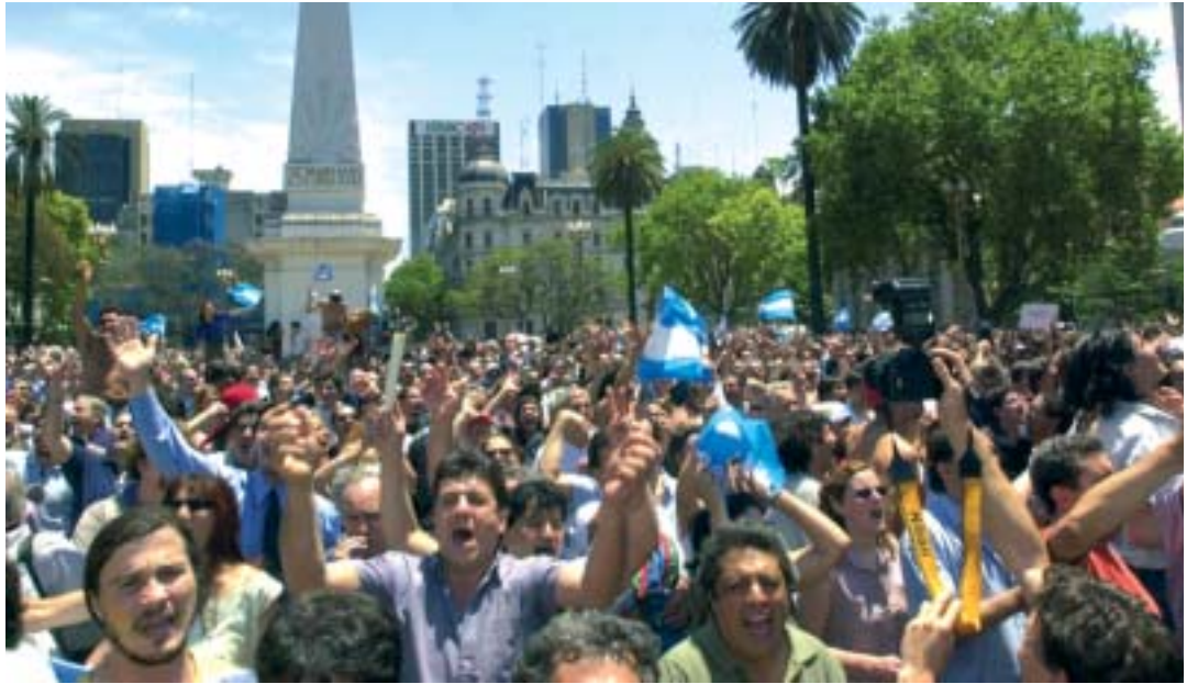
La Plaza de Mayo el 19 de diciembre de 2001, el pueblo reclamaba « Que se vayan Todos »

Nuestra discusión no es términos abstractos ni meramente teóricos sino que se viene dando en un contexto político concreto, sobre elementos de la realidad cotidiana que se produjeron y reprodujeron en la última década, y hoy nos siguen atravesando de la cabeza a los pies. La fortísima coraza que se fue armando durante las décadas de predominio neoliberal, se resquebrajó en las históricas jornadas de los años 2001-2002. Los múltiples reclamos sectoriales, provenientes de la resistencia a las duras agresiones recibidas por un amplio espectro de la sociedad de parte del modelo noventista, fueron confluyendo, hasta culminar sintetizándose en el « Que se vayan todos ».