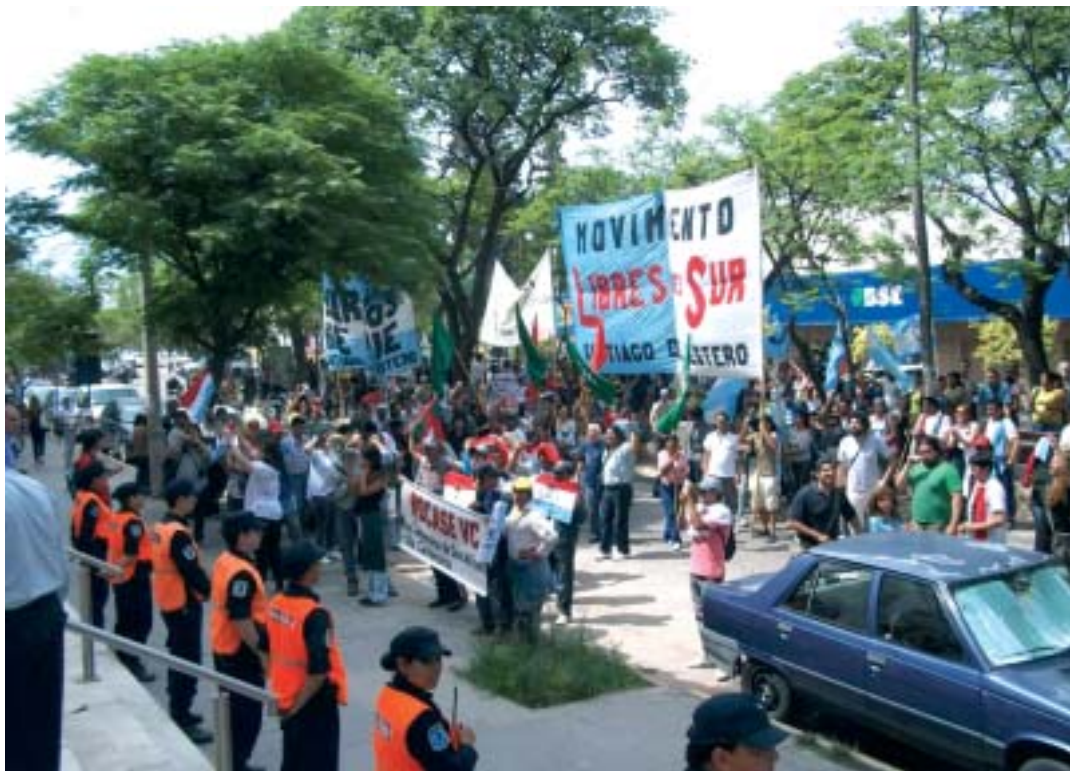
Movilización en la capital de Santiago del Estero, en repudio al asesinato de Cristian Ferreyra.

El gobernador Gerardo Zamora, que no respondió los llamados de este diario, va por su segundo man-