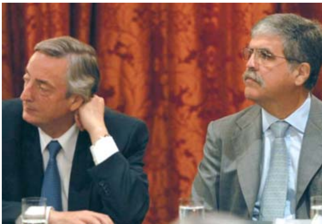
Néstor Kirchner y Julio de Vido, titular del estratégico Ministerio de Planificación.

Así llegamos a las presidenciales que ganamos con Cristina, afrontando las inevitables consecuencias de estas contradicciones, manifestadas en un importante desgaste en los centros urbanos. De ahí en adelante se fueron tomando diferentes medidas, buenas o no tanto, según el punto de vista. Pero ninguna que afectara las estructuras centrales que se habían definido y por lo tanto el flujo de ganancias monopólicas. La estatización de las AFJP, la ley de medios, la na-