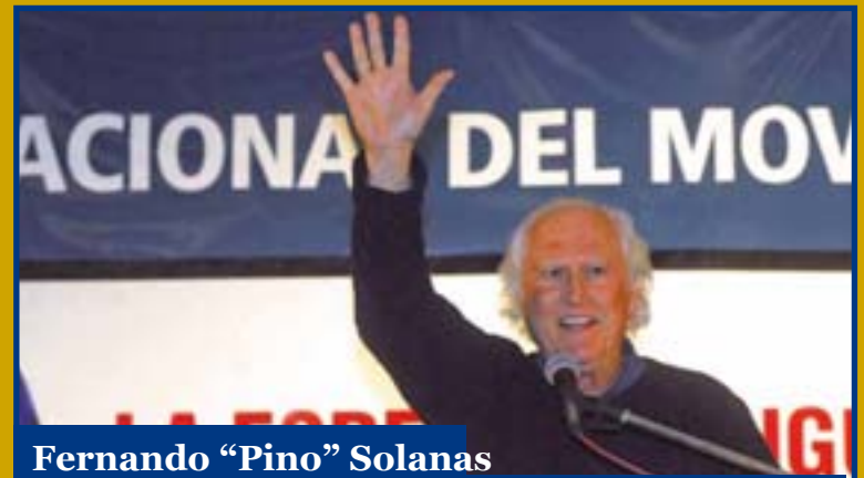
Fernando "Pino" Solanas

"...Y aquellos que nos dijeron que iban a ser honestos, distintos de los que nos habían gobernado hasta ese entonces, terminaron enriqueciéndose todos en la gestión pública; y así condujeron al fracaso esa hermosa posibilidad que se abría en nuestra nación. Y nos pidieron que los siguiéramos acompañando en ese fracaso, nos pidieron que siguiéramos con ellos. Pero eso no es para nosotros, ese rumbo no es para nosotros, a nosotros no nos atan ni las prebendas, ni los cargos, ni los recursos ¡a nosotros nos convocan las ideas, los proyectos, el amor al pueblo y a la patria, no hacerse rico en el gobierno...!"